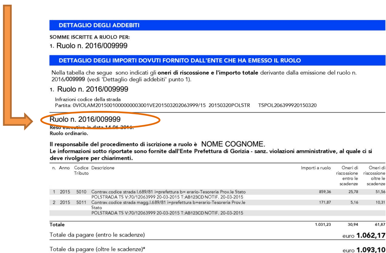
Figura 8 – Cartella ante riforma

Nell'esempio sotto riportato, e con riferimento alla cartella di cui alla precedente Figura 4, nel caso si intenda richiedere la Definizione agevolata delle sole somme affidate all'Agente della riscossione dall'Agenzia delle entrate, riferite a uno specifico carico, nel campo " identificativo carico " del prospetto a pagina 2 del modello DA-2018-R dovrà essere riportato il corrispondente numero di ruolo .